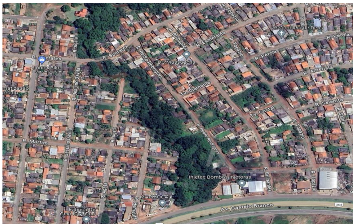
Figura 3: Região atingida pela área do decreto