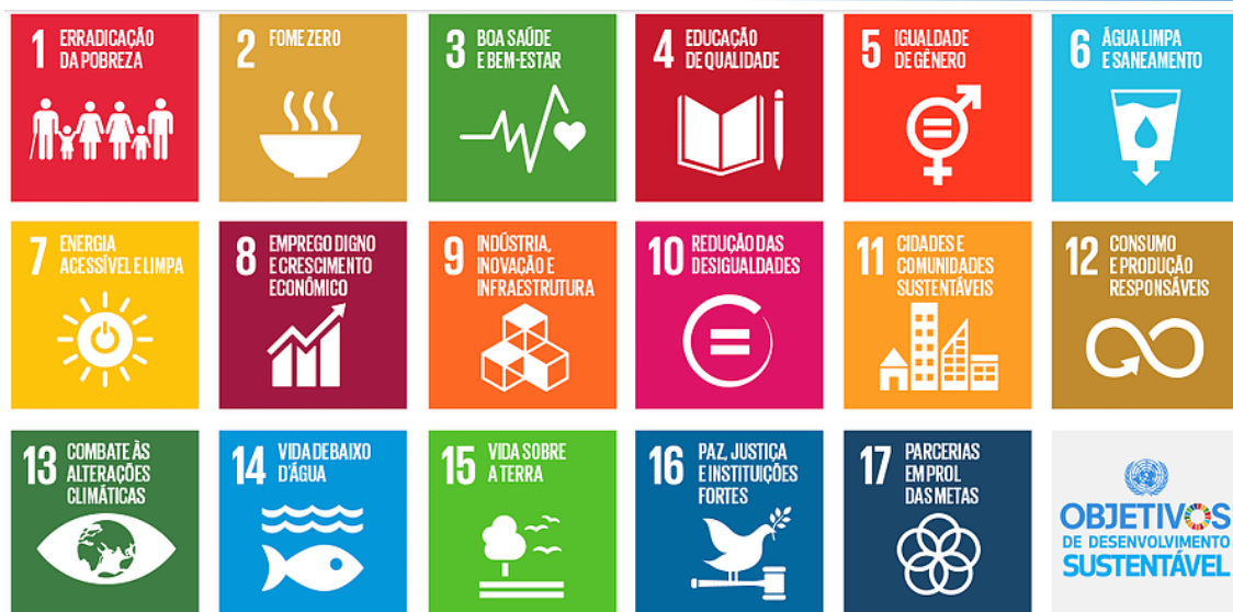
Figura 2 - Objetivos de Desenvolvimento Sustentável da ONU

Em virtude do alinhamento e dos direcionadores ASG (Ambiental, Social e Governança), a ENERGISA definiu as ODS prioritárias, sendo: ODS 7 – Energia limpa e sustentável; ODS 8 – Trabalho decente e crescimento econômico; ODS 9 – Indústria, Inovação e Infraestrutura; ODS 10 – Reduzir as desigualdades; ODS 12 - Consumo e produção responsáveis; ODS 13 – Ação contra a mudança global do clima.