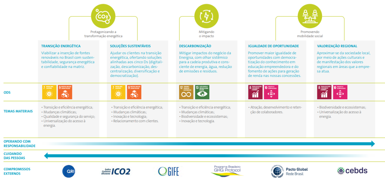
Figura 3 - ODS prioritárias da ENERGISA

A Figura 3 apresenta as ODS prioritárias da ENERGISA .