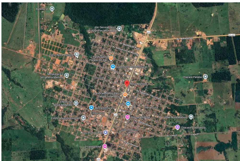
Figura 3 - Região atingida pela área do decreto